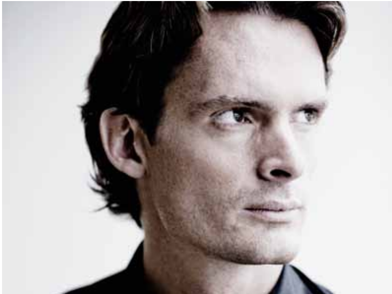
Xavier de Maistre

7. PHILHARMONISCHES KONZERT URAUFFÜHRUNG