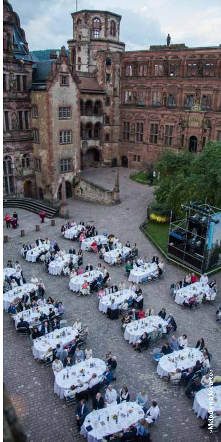
»Melodien à la carte«