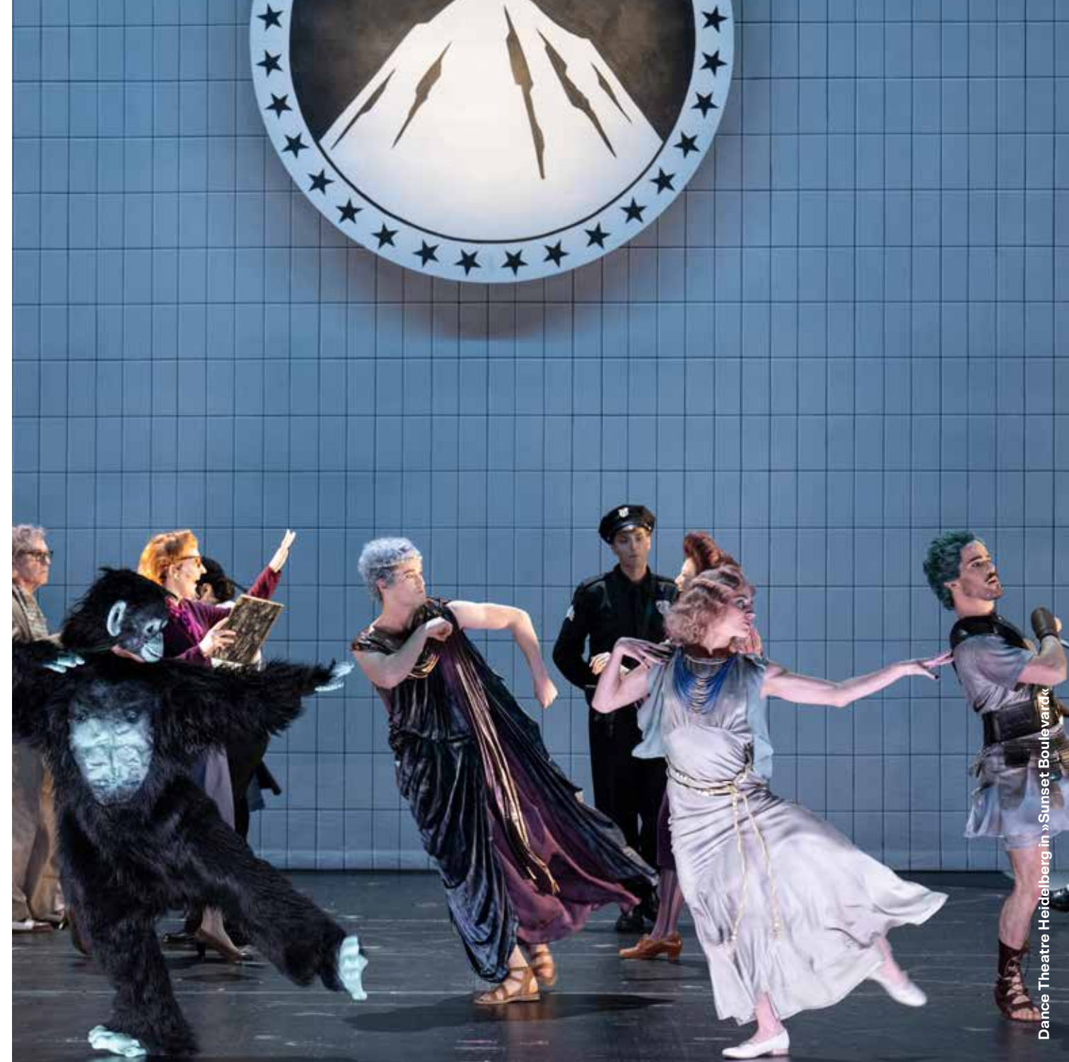
Dance Theatre Heidelberg im »Sunset Boulevard«