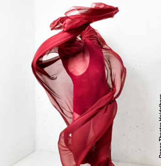
Dance Theatre Heidelberg