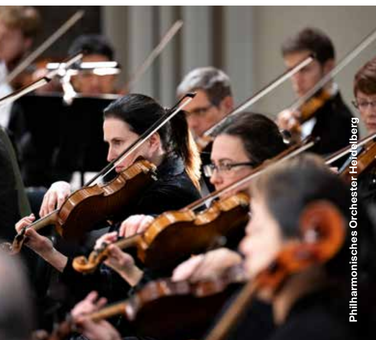
Philharmonisches Orchester Heidelberg