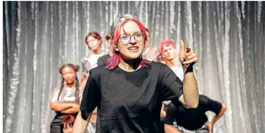
Der QUEERclub in »Hamlet – Queen of Sass«

WIEDERAUFNAHME Hamlet – Queen of Sass 9. März 2026 20:00 Uhr Zwinger 1