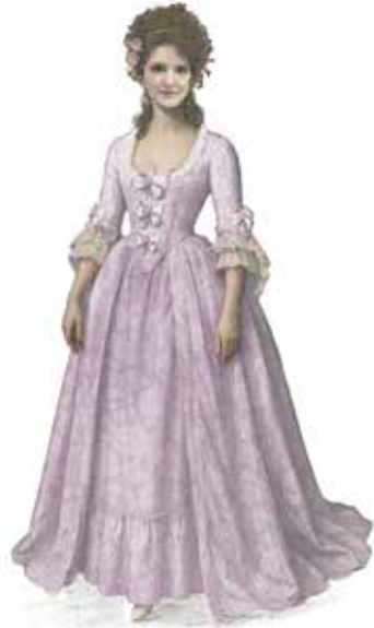
Dorabella, 1. Akt

Unter dem Titel »Cosi fan tutte o sia La scuola degli amanti« kam 1790 am k.-u.-k.-Hoftheater (heute Burgtheater) in Wien ein Stück auf die Bühne, das nichts weniger als das Thema der Treue in einer Paarbeziehung unters Mikroskop legte und mit scharfem Instrumentarium sezier-