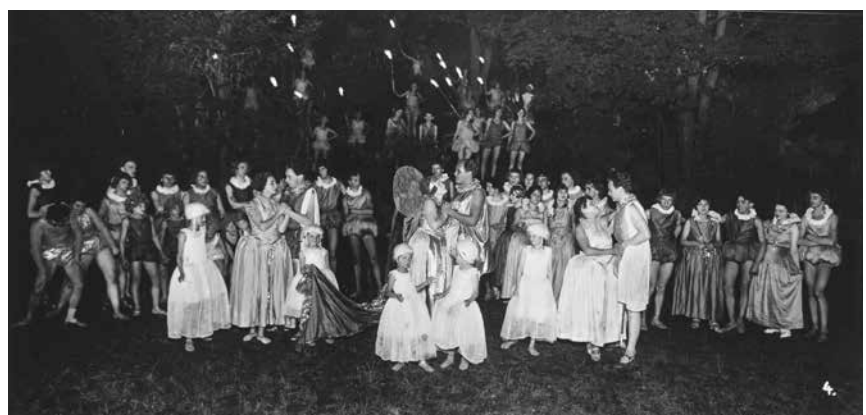
»Ein Sommernachtstraum« im Schlosshof

Exil, darunter auch Mitgründer Hartung. In den Nachkriegsjahren gibt es auf dem Schloss von 1950 bis 1958 erneut Theater, allerdings ohne Stars. Eine tiefgreifende Aufarbeitung der NS-Zeit findet nicht statt. Stattdessen erstrahlt der Schlosshof 1974 mit der Operette »The Student Prince« in neuem Glanz – und wird sogleich zum Magneten für US-amerikanische Tourist*innen. Ganze 26 Sommer wird der Dauerbrenner rauf- und runtergespielt. Daneben entwickelt sich zunehmend ein anspruchsvolles Musiktheater- und Konzertprogramm. Spätestens um die Jahrtausendwende kehren die Schlossfestspiele schließlich in dem Umfang zurück, wie sie ursprüng-