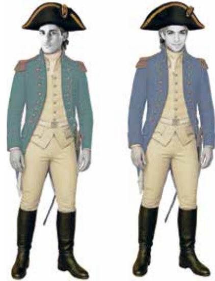
Ferrando und Guglielmo, 1. Akt Kostümfigurinen von Monika Biegler

Doch bereits bei der Uraufführung kam die heute so berühmte Zeile aus dem Operntext, eben jenes »Cosi fan tutte« hinzu, mehr noch, wurde daraus der Haupttitel. Ob aus Werbewirksamkeit oder was auch immer. Festzuhalten aber ist: »tutte« bedeutet alle, betrifft in dieser grammatikalischen Form allerdings nur die Frauen – »tutte donne«. Andernfalls hätte es im Text »tutti« heißen müssen. So war die platte eindimensionale Stoßrichtung gelegt. Entsprechend setzten sich im 19. Jahrhundert speziell in den deutschen Fassungen andere Titel der Oper durch, die ganz klar auf den ver-rutschten Fokus »Untreue = Frau« verwiesen. Am schärfsten vielleicht sogar in der ersten Berliner Aufführung 1792, die unter der Zeile »Eine macht's wie die An-