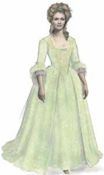
Fiordiligi, 1. Akt

dere« nur ein Jahr nach der Uraufführung (!) einen verschobenen Maßstab setzte. Warum aber rückte plötzlich von einer allgemeinen Betrachtung auf das menschliche Paarverhalten der scharfe Blick und noch schärfere Kommentar weg von den »amanti« hin zu den Frauen, den Mädchen oder gar den Weibern? Und wie schauen wir aktuell auf diese Versuchsanordnung, in einer Zeit, in der Frauen sich fragen, wie und ob sie überhaupt noch mit Männern leben wollen oder können? Wie auch immer man »Cosi fan tutte« heute erzählen möchte, an diesen Fragen kommt man im 21. Jahrhundert nicht mehr vorbei. US