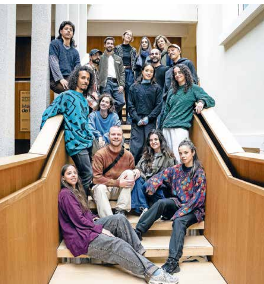
Das DTH in der Spielzeit 2025/26