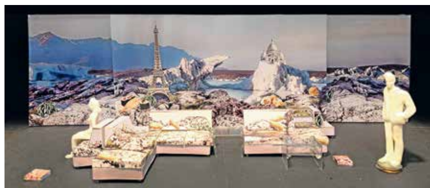
Bühnenbildmodell für »Das Abschiedsdinner« von Annette Wolf Foto: Annette Wolf

Der erste Gast von Pierre und Clotilde soll Antoine sein, ein alter Schulfreund Pierres. Alles läuft gut, bis der Gast ihrem Plan auf die Schliche kommt und gar nicht daran denkt, ihre Freundschaft kampfflos aufzugeben. Das Erfolgsautorenpaar, bekannt auch durch die mehrfach verfilmte Komödie »Der Vorname«, hinterfragt in diesem Stück auf charmante Weise den gegenwärtigen Minimalismus-Trend. Wo hört Optimierung auf und wo beginnt Egoismus? In der Regie von Katrin Sievers manövrierten sich Marco Albrecht, Lisa För-